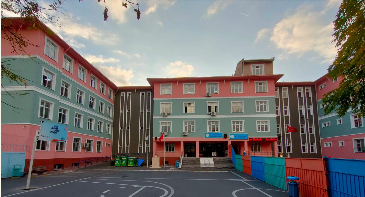
Şekil 1: Ayvalıdere Ortaokulu Önden Görünüm

Okulumuzda 61 öğretmen ve 1517 öğrenci bulunmaktadır. Okulumuz, Okul Müdürü ve 4 müdür yardımcısı ile idari hizmette bulunmaktadır. Okulumuz ikili öğretim yapmaktadır. Okulumuz ilçe merkezine yürüme mesafesi ile 10 dakika olup, tüm toplu taşıma araçları ile ulaşım sağlanabilmektedir.